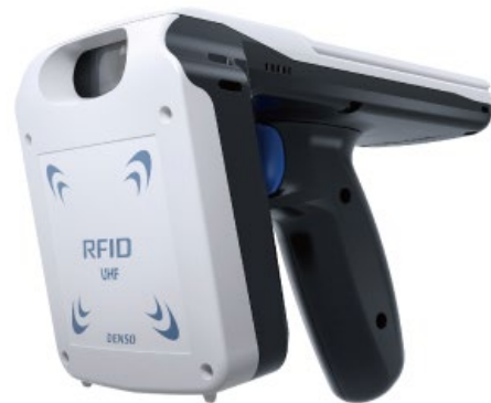
デンソーウェーブ製 UHF帯RFタグスキャナ SP1